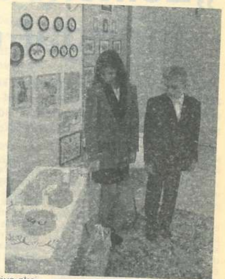
(Fent az imelyi alkalmi kiállítás egy részlete látható)