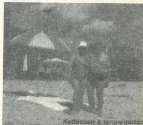
Kettesben a tengerparton

— Gyorsan vásároltunk néhány apróságot a gyerekeknek, unokáknak, azután szerdán tíz órakor