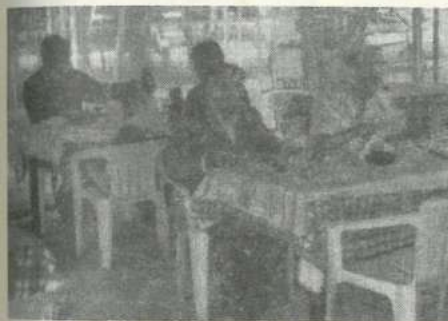
A vendéglőben már ismerősként fogadták őket