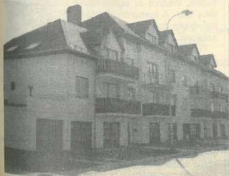
A Koreka ingatlanközvetítő tevékenységének részét képezi a képen látható nagyméretű lakások értékesítésének teljes ügyintézése.