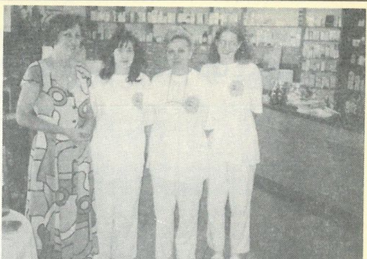
A Vág lakótelepi patikában mindig kedvesen fogadják a betéőket

• Ügy hallottam, hogy az önök gyógyszerészre kizárólagos forgalmazó és referens szolgáltatást is nyújt. — Valóban így van, gyógyszerészárunk 1998-ban a legjobb szlovákiai gyógyszerész címet elnyeréséért meghirdetett versenyben a forgalmazásban és a tanácsadói szolgáltatásban végzett munka terén a tizennegyedik helyen végzett. Ennek az eredménynek az alap-