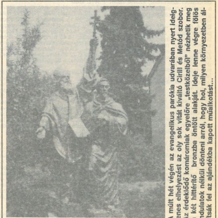
A múlt hét végén az evangélikus parókia udvarában nyert ideiglenes elhelyezést az oly sok vitát kiváltó Cirill és Metód szobor. Az érdeklődő komáromiak egyelőre „testközelből” nézhetik meg a két hittérítő bronzba öntött alakját. Ideje lenne végre fölös indulatok nélkül dönteni arról, hogy hol, milyen környezetben állítsák fel az ajándékba kapott műalkotást...