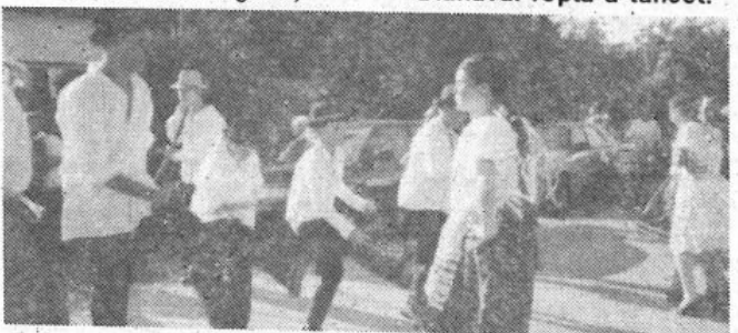
Az „utánpótlás” is bizonyította, hogy hű a hagyományokhoz.