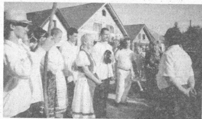
A polgármester családi háza előtt fogadta a sortáncosokat.

Pünkösdvasárnap rendezik meg Gúta egyetlen népszokását, a sortáncját. A Zobor-vidék „villőzéséhez” hasonlóan (bár ez pünkösd hétfőjére esik) a fiatal fiúk és lányok népviseletbe öltözve járták a várost, s ahová meghívták őket, nótaszóval, rigmusokat mondvá köszöntötték a háziakat, majd friss csárdás dallamára megforgatták a ház népét. Az idei sortáncosok java részt az egyházi gimnázium tanulói, s így iskolájuk elől indult a menet, amely felkereste a városházát, ahol a város vezetői fogadták a táncosokat, akik azután este hat óráig járták a várost. Immár hagyomány, hogy a sortáncjárás a polgármester családi házánál ér véget, ahol az éppen ott vendégeskedő A. Nagy László parlamenti képviselő sem kerülhette el sorsát, hiszen alaposan megtáncoltatták a lányokat.