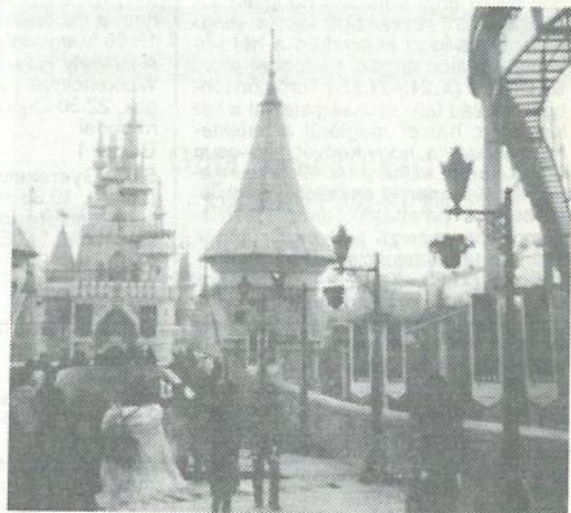
Csodavilág a szülői vidámparkban

nyasszonyok és vőlegények. Csodálatos volt. Hát ennyi lenne dióhéjban. Hiába is törekednék részletesebb leírásra, kudarcba fulladna minden kísérletem. Mert igazán csak az érezheti át azt a fantaszti-