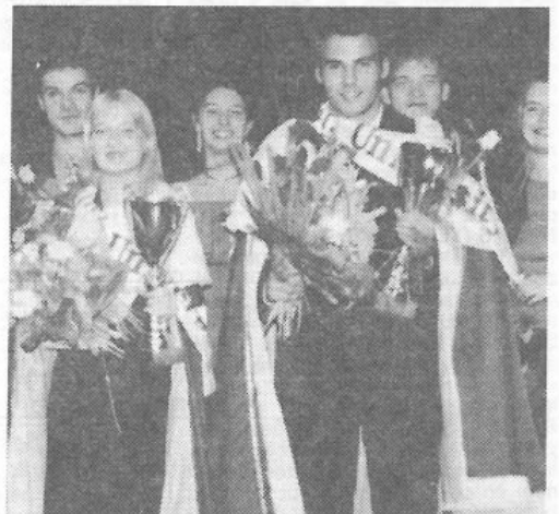
Budapestten, a „király” és a „királynő” az eredményhirdetés pillanatában

ről kézre adtak bennünket, így jutottunk el Szöul legimpozánsabb, legnagyobb szállodájába, a Seoul Olympic Parktel-ba.