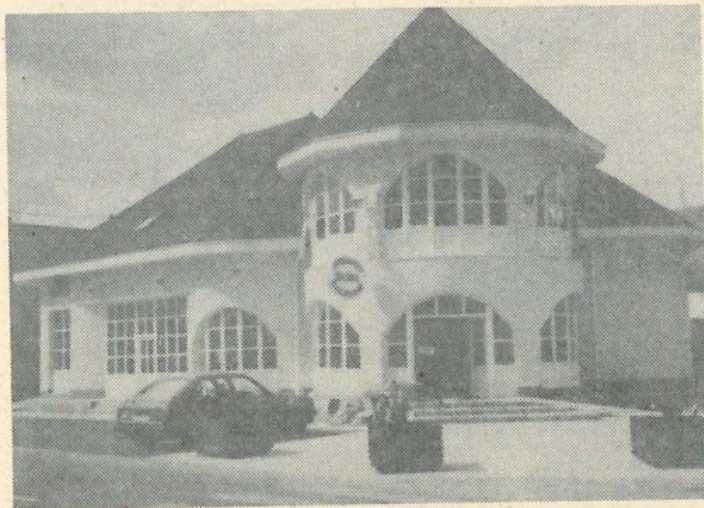
A Hajnal élelmiszerüzlet

rendszerültetés után a cégek java része megszünt, s a város vezetősége nem talált beruházót a befejezéshez. Egy ideig a Nyugat-szlovákiai Gázművek is kacérkodott a gondolattal, hogy körzeti szerelőállomást létesít itt, de ké-