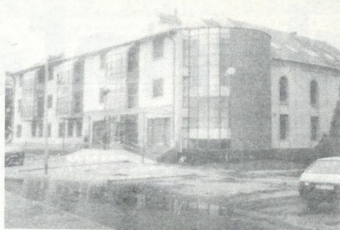
Az épület impozáns színfoltja lett Komárom városának