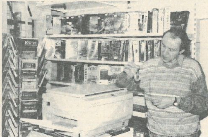
A tamagocsiól a legkülönbélebb számítógépprogramokig és elektronikus játékokig mindent megtalál az érdeklődő.

célszámítógépeket, számítógéphálózatot telepítünk, s a legkülönbélebb programcsomagot biztosítjuk. Külön grafikai, szövegszerkesztői, rendszerirányítói, könyvelési programjaink vannak, s mi több, mi a singelli Új utca 3. szám alatti (telefonszám: 710 060) központunkban számítástechnikai kurzusokat tartunk, ahol évente mintegy 150 hallgatónk szerez megbízható ismereteket a vásárolt programok üzemeltetéséhez. Külön örömmre közveltenül hozzánk fordulnak a problémáikkal. Egy-egy