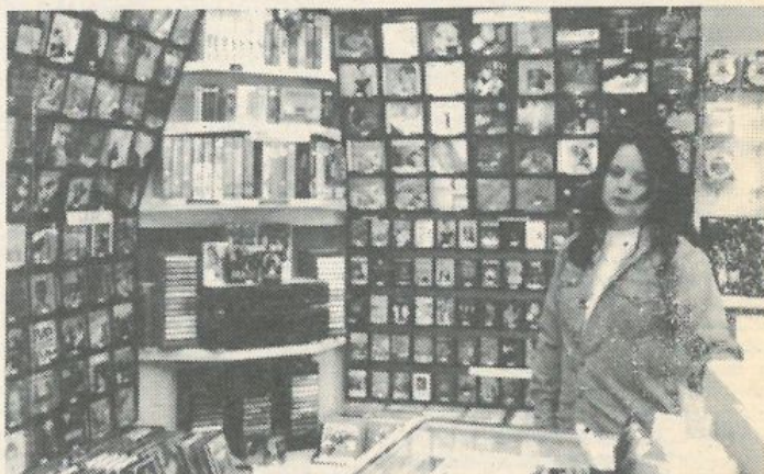
Itt azután kedvükre válogathatnak a „vajtűfülűek”.

• A számítástechnika legújabb és egyre jobban terjedő ága az