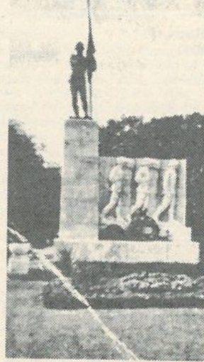
Ilyen volt a komáromi 12. gyalogezred emlékműve