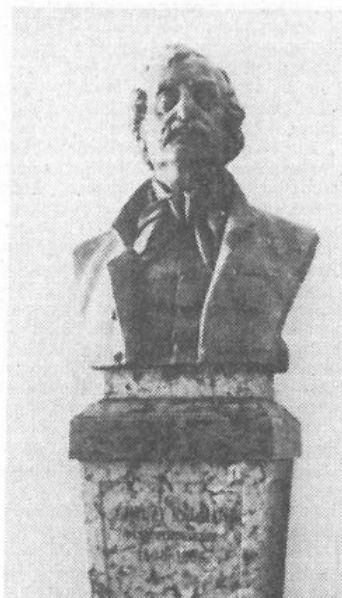
Ghyczy Kálmán mellszobra a megyeházán

Itt állott az ősi kúria, melyben 1808 február 8. született GHYCZY KÁLMÁN Komárom legnagyobb követe, a képviselőháznak ismételten elnöke, az ország pénzügyminisztere, fényes példája a hazafiúi lelkiismeretnek és munkásságnak bölcsségnek és hűségnek. Komáromvármegyei és Városi Múzeum Egyesület 1908. Az emléktábla 1908. október