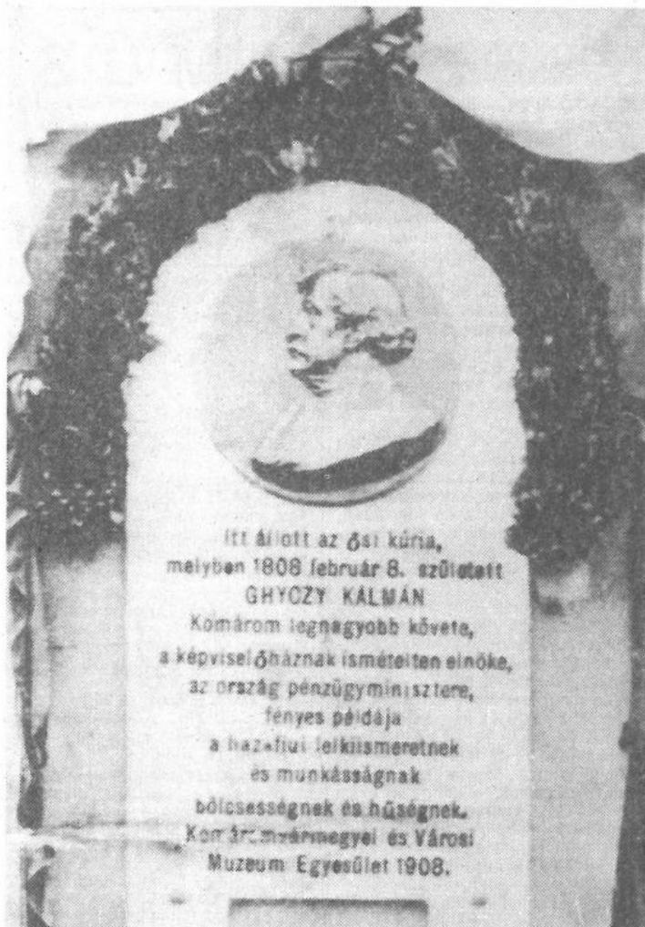
A felavatott Ghyczy-emléktábla