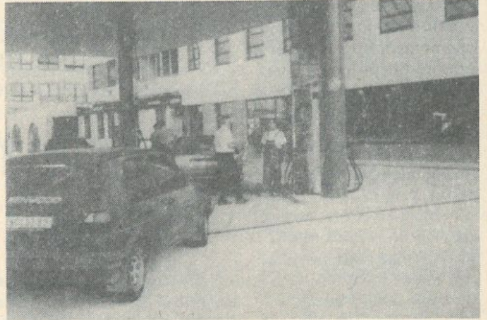
A múlt hét csütörtökén adták át a pozsonyi főút mellett az új HOFFER benzinkutat, amely ezen a napon rekláméron, 20 koronáért árulta a benzint.