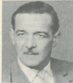
A gyászoló család

aki rövid szenvedés után, életének 80. évében távozott szerettei köréből. Köszönjük a sok-sok virágot, a részvétnyilvánításokat, melyekkel igyekeztek enyhíteni mély fájdalmunkat.