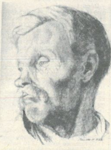
Staudt-Csengeli Mihály: Tanulmányfej, 1925 (a ceruzarajzot a Duna Menti Múzeum képtárában őrzik)

Staudt-Csengeli Mihály 1945 után Pozsonyban élt, ahol festőként és restaurátorként működött. Az ötvenes években kisebb, realizistikus képeket festett, továbbá különböző szociális témákat és komáromi ársvízi motívumokat vitt vászonra. Szlovákia-szerte számos freskót és festményt restaurált. Képzőművészeti alkotásainak témája sokrétű: a mindennapi élet széles területe éppúgy megtalálható, mint a földöntúli kozmikus tér. Pályafutása alatt elsősorban a korszerű irányzatok vonzóiták, főleg a konstruktivizmus, később pedig az impresszionizmus és a fotonaturalizmus. Pozsonyban 1957-ben, 1963-ban és 1970-ben rendeztek kiállítást alkotásai- ból, míg szülővárosában 1971-ben. Staudt-Csengeli Mihály műveit a Szlovák Nemzeti Galériában, a Pozsonyi Galériában, a Duna Menti Múzeumban és különféle magángyűjteményekben őrzik. A csehszlovákiai magyar képzőművészet kiemelkedő alakja 1970. március 26-án hunyt el Pozsonyban. (th)