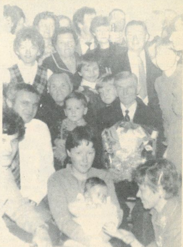
És mindenki még rá sem fért a fényképre...