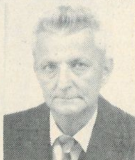
Emlékét őrző családja

Akik ismerték és szerették, gondol- janak rá ezen a szomorú első évfordulón.