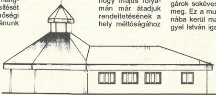
Az átalakított gútai ravatalozó tervrajza a toronnyal és a fedett térral.

folyamatosságát tartottuk szem előtt. Még a múlt év végén hozzáltunk a korábbi tetőszerkezet megbontásához, az ácsolatok elkészítéséhez, s úgy tervezzük, hogy május folyamán már átadjuk rendeltetésének a hely méltóságához