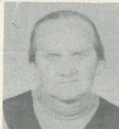
A gyászoló család