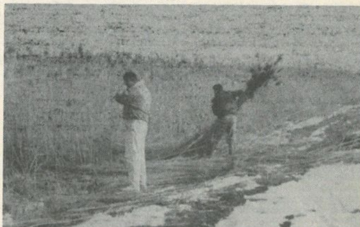
Az iskola természetes anyagokat feldolgozó tanszakának diákjai telente saját maguk vágják a gyékény alapanyagát.

— A legtöbb probléma abból adódik, hogy csak megfelelő szociális helyiségekkel rendelkező, az úttétől kellően védett épületekben folytatható szakmai oktatás. Most tárgyalásokat folytatunk a városi önkormányzattal újabb helyiségek bérbérvételéről, s akkor a kozmetikusok a város központjában részesülhetnek a