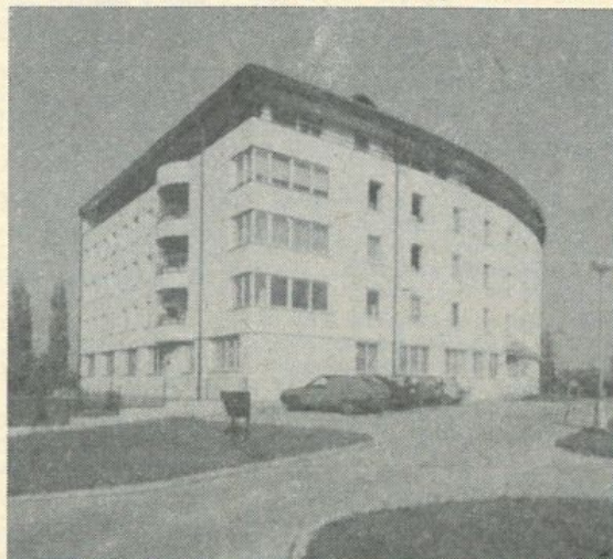
Ebben a csodálatos épületkomplexumban, a városi nyugdíjaspanzióban voltak elszállásolva a komáromi vendégek.

A közös kultúrműsor keretében a komáromi nyugdíjasok énekkel és szlovák és magyar nyelven adott elő egyveleget. Külön megemlékeztetés