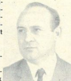
A gyászoló család

Köszönjük a virágadományokat és részvényilvánításokat, melyekkel igyekeztek enyhíteni mély fájdalmunkat.