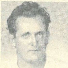
A gyászoló család

Köszönjük a virágadományokat és részvényt nyilváníásokat, melyekkel igyekeztek enyhíteni mély fájdalmunkat.