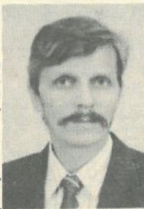
A gyászoló család

Köszönjük a sok koszorút, virágot, az együttérzést és a részvényt nyilváníásokat, amellyel enyhíteni próbálták mély fájdalmunkat.