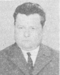
A gyászoló család

Emlékezzenek rá, akik őt szerették, emléket szívünkben féltve megőrizték.