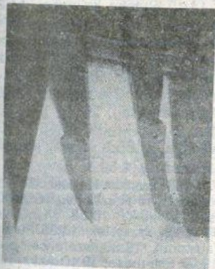
A gyilkosok fegyverek

A gútai rendőrpáncsnokságon ezalatt folytatódott az éjszakai „pároccka” kihallgatása. Továbbra is fenntartották vallomásukat, miszerint a lefoglalt árut az éjszaka vásárolták a bezárt Vág szálló melletti vendéglőben. Most már az eladó személyek csúfneve is eszükbe jutott. Úgy tűnt, va-