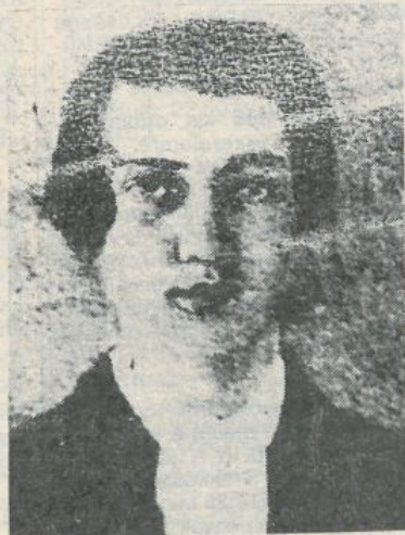
Jókai fiatalkori önarcképe