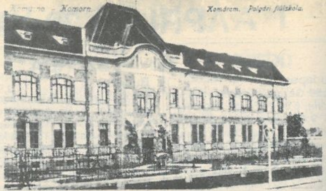
A polgári fiúiskola épülete a századelőn