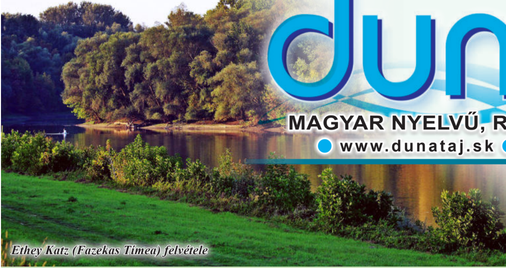
Ethey Katz (Fazekas Timea) felvétele