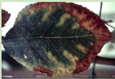
A réz hiányának tünetei a szilván

A tápelemek – növényélettani szerepüket tekintve – a többi növényhez hasonlóan a gyümölcsökben is azonosak, de jelentős táplálkozási fiziológiai sajátosságokkal rendelkeznek. A gyümölcsösök élő kultúrák, gyakran évtizedekig megőrzik termőképességüket. Tápanyagellátásuk nem egy adott év termését, vegetatív működését befolyásolja, hanem több évre kihat. Tápanyagfelvételük a nyugalmi időszakban nem számottevő, de az őszi tápanyagfelvétel akár gyökéren, akár lombon keresztül jelentős lehet.