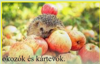
okozók és kártevők.

A ribizske, egres és köszmetebokrokot ritkítsuk meg. A levegő és a fény minden ágat érjen, a lényeg, hogy ne árnyékolják egymást. A málna- és szeder-vevőket a föld felett közvetlenül vágjuk le, és tövenként a legerősebb hajtásokból hagyjunk meg 5-6 tövet. A támrendszert ilyenkor a legjobb felújítani, kibővíteni. A metszés során keletkezett növényi hulladékot soha ne hagyjuk a bokrok alatt, mert ezekben általában mindig található kór-