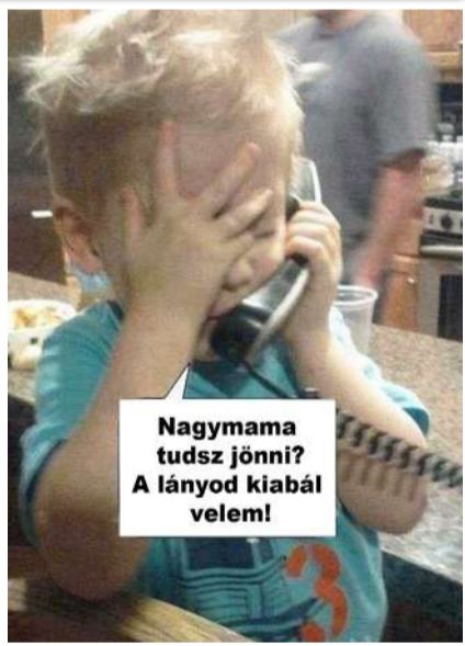
Nagymama tudsz jönni? A lányod kiabál velem!

A farmer lánya hazaérkezik és boldogan újságolja: – Képzeltétek, Jack feleségül akar venni. – Megkérte a kezét? – Még nem, de már lelőtte a feleségét. – Melyik az én bal kezem, Jean? – Hát a szélső! – De Jean, nekem mind a két kezem szélső! – Akkor két bal keze van, uram. A feleség nagyon aggódik, mert az anyja súlyos betegen fekszik a kórházban. Míg dolgozik, elküldi a férjét, hogy nézzen utána, mik a fejlemények. Egy óra múlva felhívja: – Hogy van a mama? – Anyádat bármelyik pillanatban hazaengedhetik. – Micsoda? Már jobban van? És hazaengedik az intenzív osztályról? Ez meg hogy lehet? – Nem tudom, még csak be sem engedtek hozzá, de a főorvos azt mondta, hogy készüljek fel a legrosszabbra.