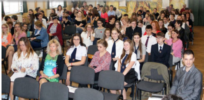
A Dobré slovo verseny résztvevői és kísérőik