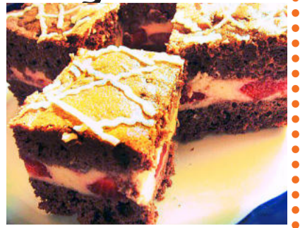
1 csomag zselatinfix 30 dkg eper A díszítéshez: 5 dkg fehér csokoládé