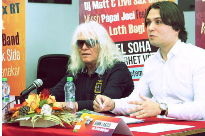
Kóbor János és Gubik László a sajtótájékoztatón

A szombat este fénypontja az Omega nagykoncertje lesz. A sajtótájékoztató meglepetésembereként Kóbor János, a rockzenekar frontembere elmondta, hogy nagyon várják az eseményt, hiszen a szabadtéri koncertnek mindig megvan a maga különleges varázsa. – Nagyon jó állapotban van a csapat, jó hangulatban. Addig jó a csapat, amíg így működik – árulta el Kóbor János.