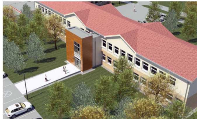
A gútai egészségügyi központ átépítésének látványterve, ahol központi helyet kapott a felvonó

Átépítése után a gútai egészségügyi központ regionális jellegűt kap és az ott dolgozó szakorvosok a környék településén élők egészségéről is gondoskodnak.