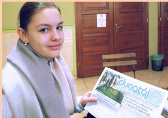
A határon túlról érkezett fiatalok is érdeklődve lapozgatták a Dunatáj