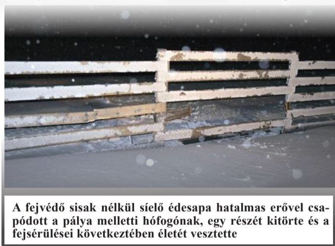
A fejevédő sisak nélkül sielő édesapa hatalmas erővel csapódott a pálya melletti hófogónak, egy részét kitérte és a fejsérülései következtében életét veszítette