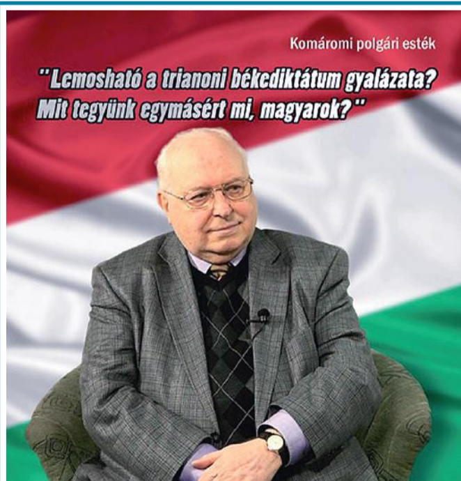
Komáromi polgári esték

3. és 12. között rendezik meg Karván, a szakközépiskolában, neves drámapedagógusok és oktatók közreműködésével.