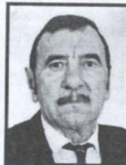
A gyászoló család