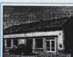
Nehnuteľnosť predajňa s č. 559 v obci Svätý Peter.

Predajná cena nehnuteľnosti 150 000,- €. Dohoda je možná.