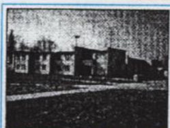
Objekt rekreačnej chaty v areáli termálneho kúpaliska Patince, okres Komárno.

Rekreačné zariadenie je jednoposchodová murovaná budova s kapacitou 12 izieb (28 lôžok + 12 prísteliek), pričom každé dve izby majú spoločné WC, sprchu a umývadlo. V budove sa ďalej nachádzajú: jedáleň pre 40 osôb, malá jedáleň pre 20 osôb, spoločenskú miestnosť pre 10 osôb, miestnosť na sledovanie TV, kuchynka pre hostí, kuchynka a bufet. V suteréne budovy sa nachádza bazén, sprchy, sauna, odpočívacia a spoločenská miestnosť. Zastavaný pozemok je na predaj a je vo vlastníctve obce.