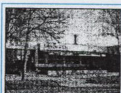
Nehnuteľnosť reštaurácia Jánošík s č. 1892 v Kolárove.

Predajná cena nehnuteľnosti 40 000,- €. Dohoda je možná.