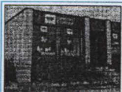
Nehnuteľnosť predajňa s č. 1933 v obci Nesvady.

Nachádza sa na ul. Budovateľskej č. 1 na parcele č. 3696/2 v k.ú. Nesvady, vedenej vo výpise z LV č. 3681. Pozemok na parcele 3696 o výmere 528 m 2 a je vo vlastníctve Obecného úradu Nesvady, pričom je možnosť jeho odkúpenia.