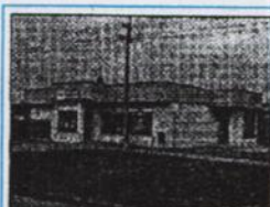
Nehnuteľnosť bývalá predajňa potravín a pohostinstva s č. 849 v obci Zlatná na Ostrove.

Predajná cena nehnuteľnosti 45 000,- €. Dohoda je možná.